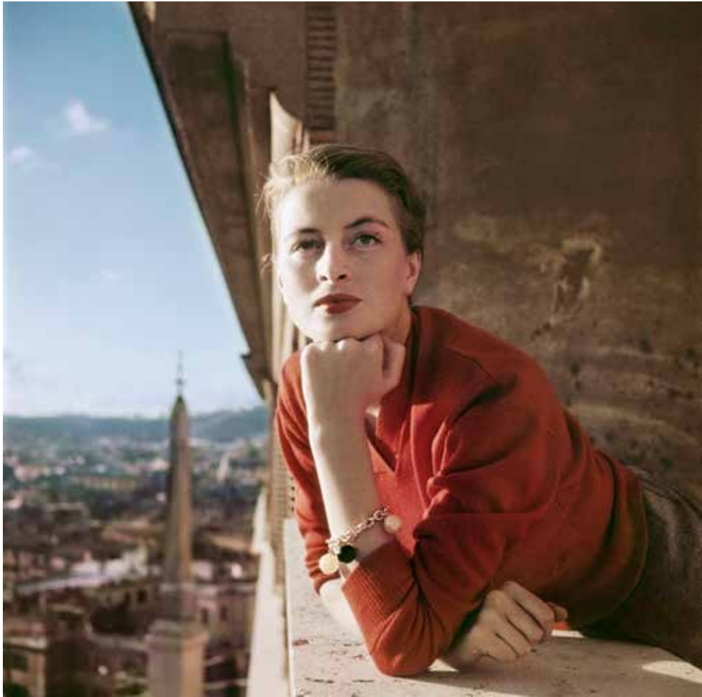
Le mannequin français Germaine Lefebvre, dite Capucine. Rome, 1951.