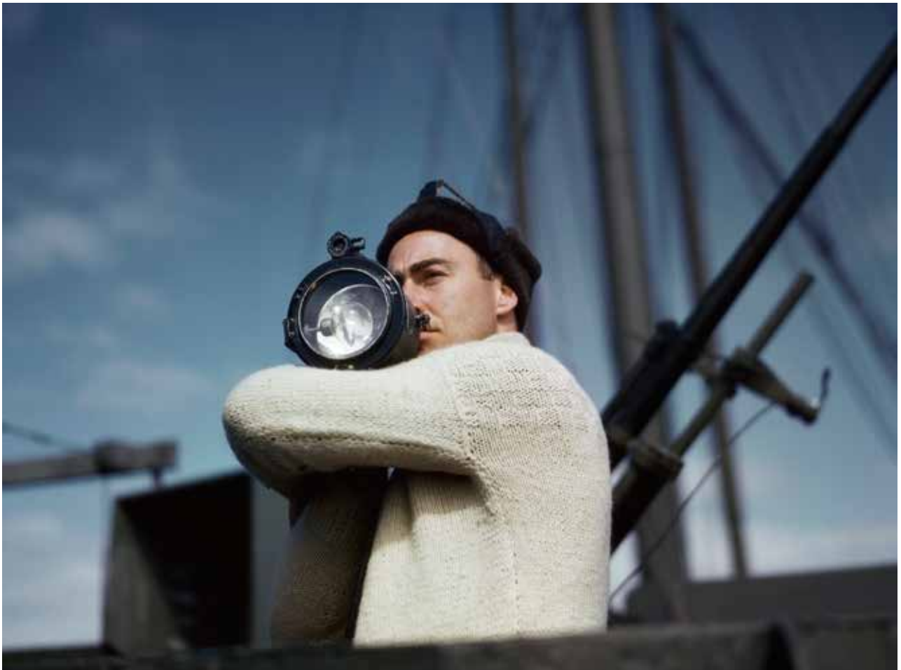
Un matelot d'un cargo communique par signaux avec un autre bateau d'un convoi allié en route vers la Grande-Bretagne. Océan Atlantique, 1942.