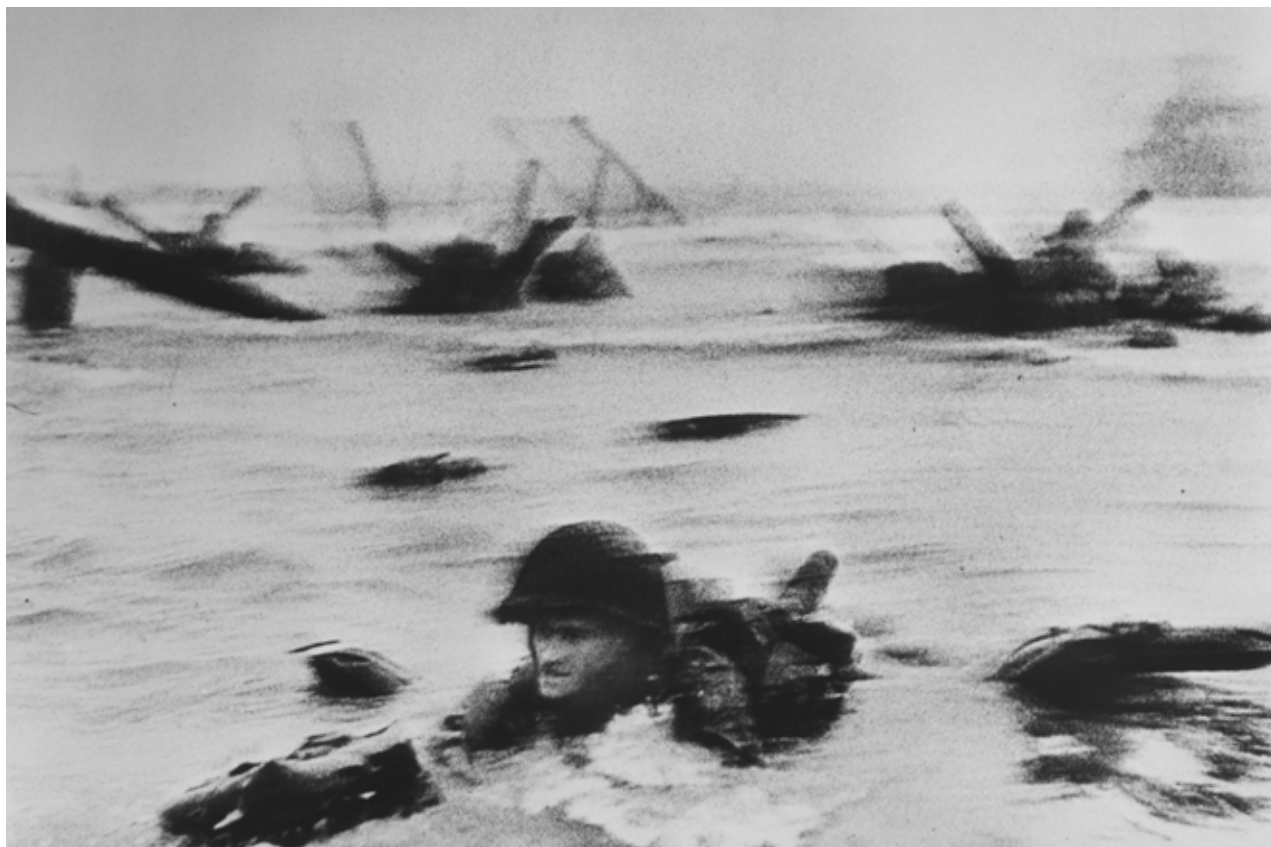
La première vague de troupes américaines débarque. Omaha Beach, Normandie, 6 juin 1944.