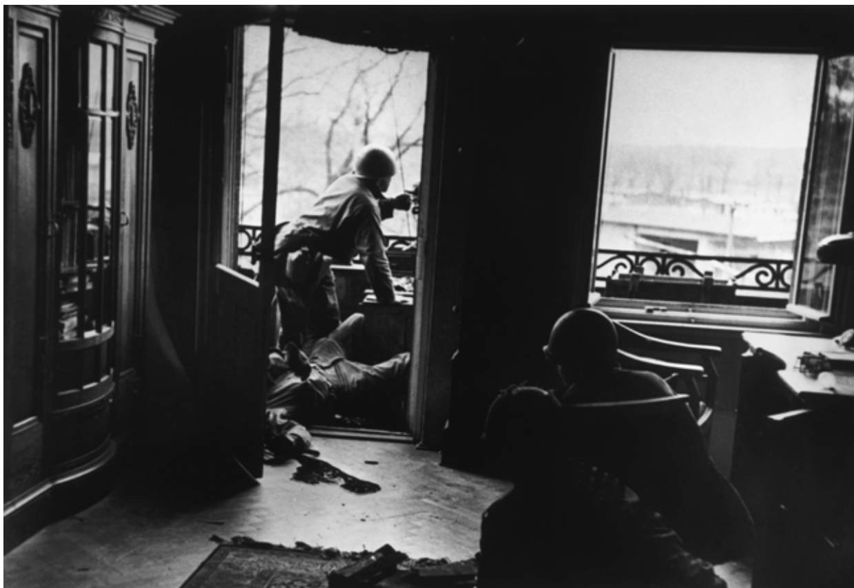
Leipzig, Allemagne, 18 avril 1945.

Aussitôt après la libération de la ville, une femme française qui a eu un enfant avec un soldat allemand a la tête tondue en signe d'humiliation. Chartres, France, 18 août 1944.