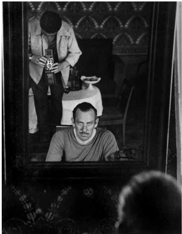
Robert Capa se photographie avec John Steinbeck lors de leur voyage en Russie. Moscou, août-septembre 1947.