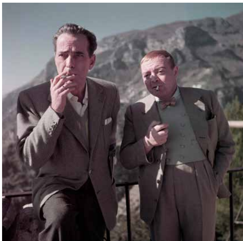
Humphrey Bogart et Peter Lorre sur le tournage de Plus fort que le diable de John Huston. Ravello, Italie, avril 1953.