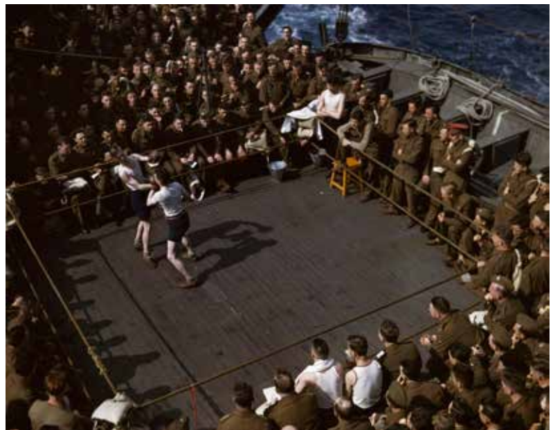
Des soldats britanniques assistent à un match de boxe sur un navire de transport de troupes entre l'Angleterre et Casablanca. 1943.