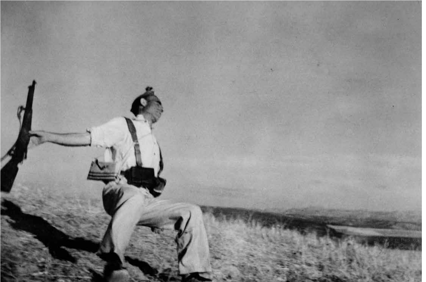
Républicain tombant. Front de Cordoue, Espagne, début septembre 1936.